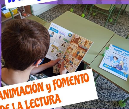
ANIMACIÓN y FOMENTO DE LA LECTURA