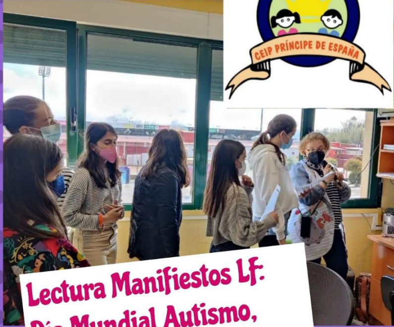
Lectura Manifiestos Lf: Dia Mundial Autismo, 8M...